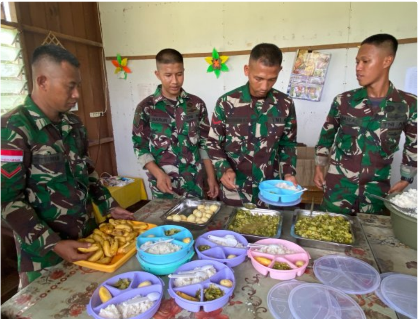
Foto: Dedikasi Satgas Pamtas Mobile RI-PNG Yonif 503/Mayangkara dalam mendukung program makan bergizi gratis pemerintah mendapat apresiasi tinggi dari masyarakat Distrik Krepkuri, Kabupaten Nduga, Papua, di sekolah rimba, Rabu (29/01/2025).