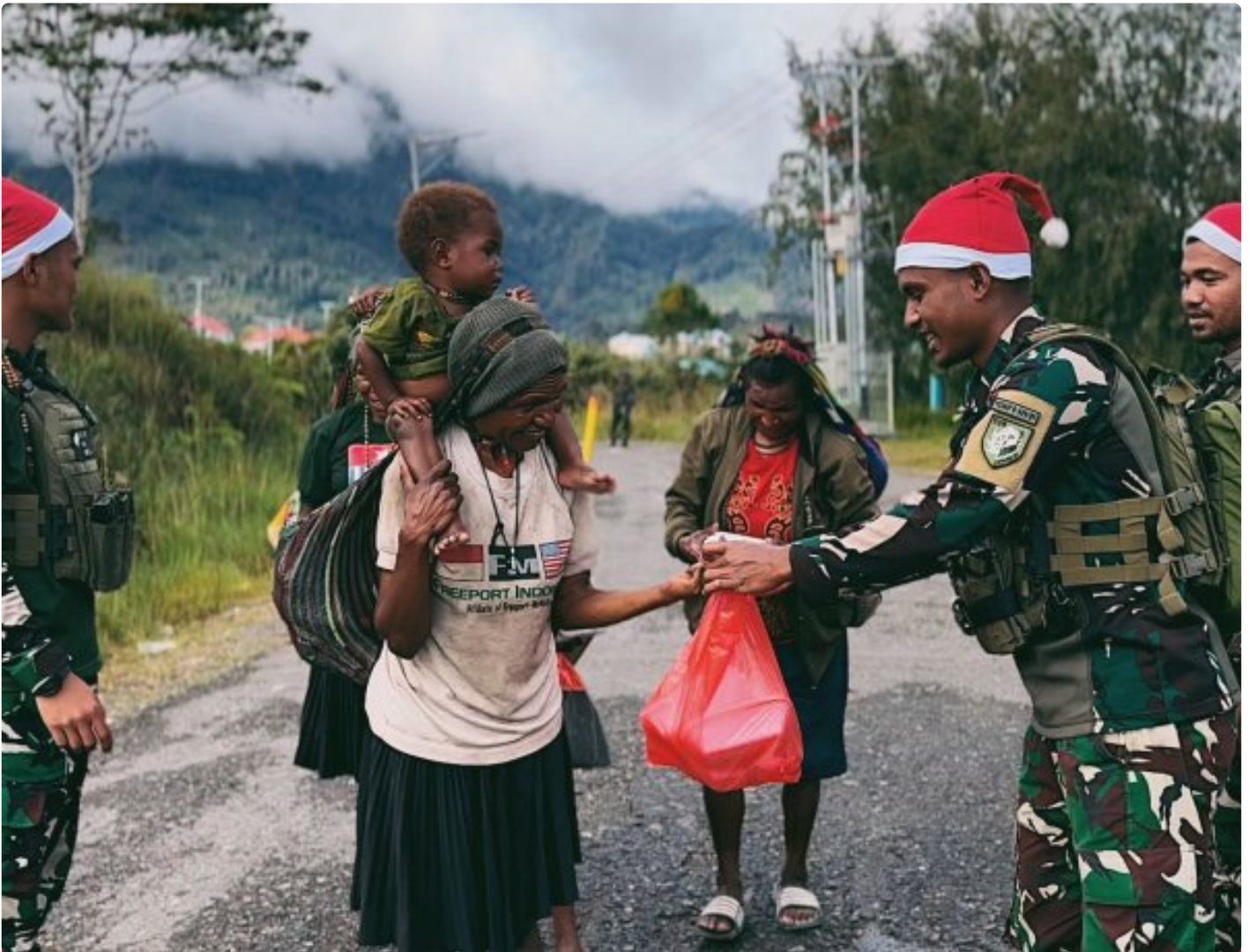
Foto: Satgas Yonif 509 Kostrad memberikan makna baru pada patroli keamanan dengan berbagi kebahagiaan bersama masyarakat di Intan Jaya, Papua.

PAPUA- Dalam balutan semangat Natal yang damai, Satgas Yonif 509 Kostrad